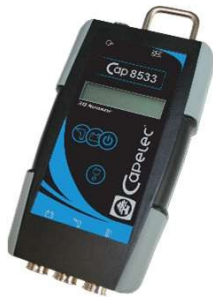
CAP8533 Vibrations- und Batterie-Tachometer